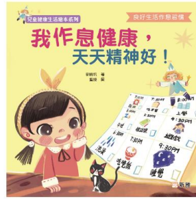
兒童健康生活繪本系列: 我作息健康, 天天精神好! 麥曉帆