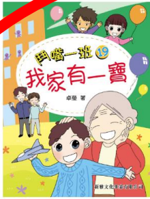
鬥嘴一班19: 我家有一寶 卓卓