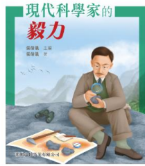
中國人的故事: 現代科學家的毅力 張倩儀