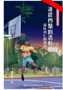
擁抱世界正能量5: 凌晨四點的洛杉磯: 高比拜二的傳奇 關麗珊